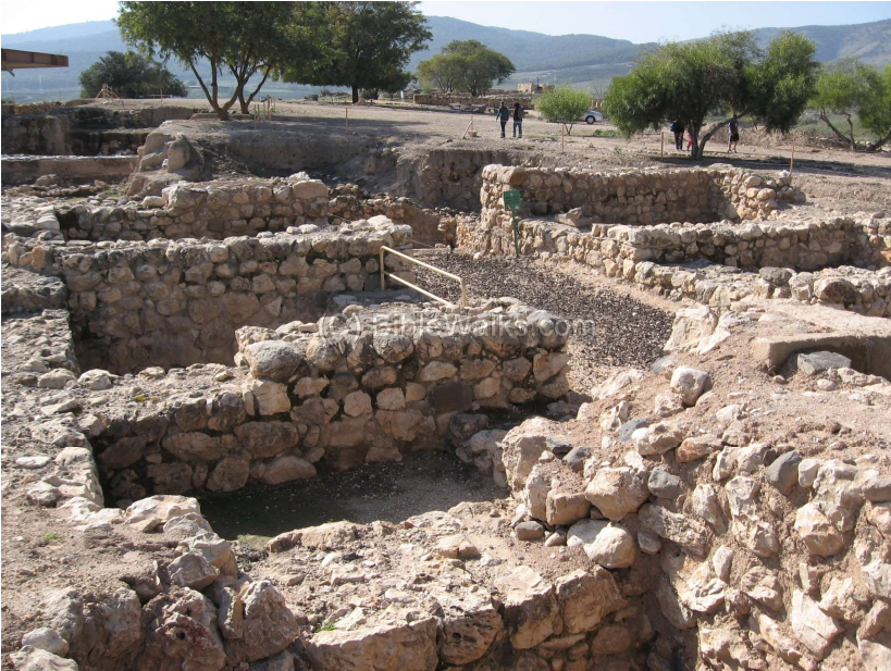
Hazor, Nordisrael, von König Ahab (875-852) zur Festung ausgebaut