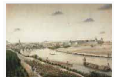
Lauffen von Südosten. Aquarell um 1800

Gegen Ende des 18. Jahrhunderts rückte Lauffen aufgrund seiner strategisch wichtigen Lage erneut in den Mittelpunkt kriegerischer Auseinandersetzungen. Im Juli 1796 traf kaiserliche Artillerie mit einer großen Menge Munition in Lauffen und Talheim ein. 1799 zog sich die österreichische Infanterie von Heilbronn nach Lauffen zurück, wohin Herzog Friedrich von Württemberg zum Schutz gegen die vom Rhein vorrückenden Franzosen bereits große Truppenverbände geschickt hatte. Den Franzosen, die Heilbronn 1799 allein dreimal heimsuchten, gelang im Zuge der Kampfhandlungen abermals die Einnahme von Lauffen, wo sie Häuser anzündeten, plünderten und Geiseln nahmen.