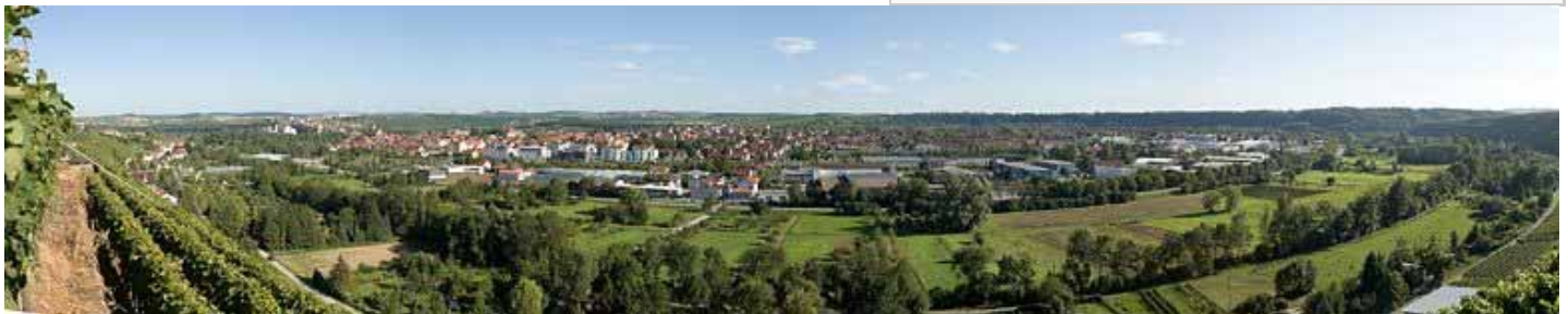
Lauffen vom Geigersberg aus gesehen