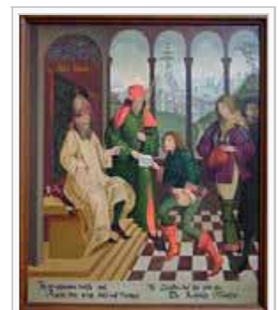
Kaiser Ludwig belehnt im Jahr 832 Graf Ernst mit Lauffen, Gemälde in der Regiswindiskirche

832 verlehnt Kaiser Ludwig der Fromme den noch unbefestigten Ort an seinen Schwiegersohn Ernst, den Grafen des oberpfälzischen Nordgaus, mit der Auflage, den unwirtlichen Ort des Kaisers würdig auszugestalten, der dort zu jagen gedachte. Auf Ernst geht die früheste Kultivierung der Neckarhänge und die älteste Anlage einer Burg zurück. Die Tochter des Grafen, Regiswindis, wurde jedoch im Kindesalter von ihrer Amme getötet und der Leichnam in den Neckar geworfen, worauf sich Markgraf Ernst wieder in seinen Stammgau in der Oberpfalz zurückzog, so dass Lauffen noch vor Ablauf der Lehensdauer und dem Tod des Grafen ab dem Jahr 861 wieder direkt dem Kaiser unterstand. In den Jahren 889, 923 und 993 übertrugen verschiedene deutsche Kaiser dem Bistum Würzburg die Herrschaft über den Ort. 1003 spricht sich Kaiser Heinrich II. für die Gründung eines Klosters in dem inzwischen befestigten Ort aus, worauf unter Bischof Heinrich von Würzburg ein Frauenkloster des Benediktinerordens entsteht.