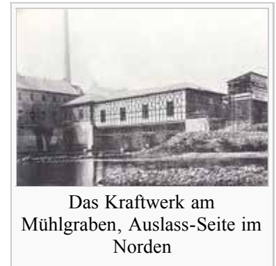
Das Kraftwerk am Mühlgraben, Auslass-Seite im Norden

Zugleich wurde ein ca. 6 Meter hoher künstlicher Wasserfall betrieben. Nach Ende der Ausstellung wurde der Strom des Drehstromgenerators weiterhin noch bis Heilbronn übertragen, das damit als erste Stadt der Welt die reguläre Fernversorgung mit Strom aufnahm. Noch heute erinnert der Name des lokalen Energieversorgungsunternehmens – ZEAG (kurz für "Zementwerk Lauffen - Elektrizitätswerk Heilbronn AG") – an diese Tat.