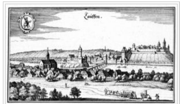
Lauffen um 1640. Illustration aus Matthäus Merians Topographia Sueviae , 1643. Links das Dorf , rechts am anderen Flussufer die Stadt , in der Mitte die Insel mit der Burg