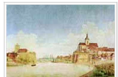
Lauffen, Burg und Regiswindiskirche von Nordwesten. Aquarell von Caspar Obach um 1850

Das 19. Jahrhundert stand in Lauffen insbesondere unter dem Zeichen der Kultivierung des Bodens. 1820 wird der See trockengelegt. Die Einwohner verlieren dadurch eine reiche Nahrungsquelle, aber auch die Ursache vieler Fieberkrankheiten. 200 Morgen neuen Ackerlandes entstehen dabei. Der Weinbau erlebt eine Blüte, indem auf unrentable Sorten verzichtet wird und