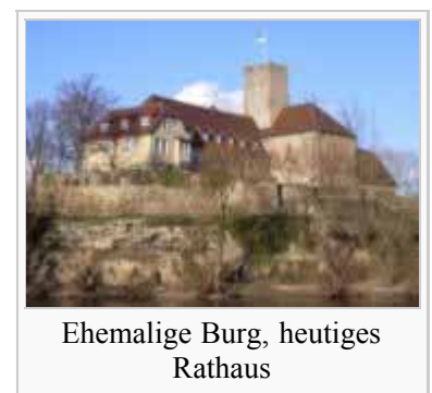
Ehemalige Burg, heutiges Rathaus

Weiteres Mitglied des Gemeinderates und dessen Vorsitzender ist der Bürgermeister.