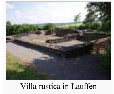
Villa rustica in Lauffen

Das Gebiet um Lauffen wurde vermutlich schon in vorchristlicher Zeit besiedelt, was jedoch nur durch sehr wenige Knochenfunde belegt ist. Die höhere Frequentierung des Ortes kann aus dem Umstand abgeleitet werden, dass der Fluss zwischen der heutigen alten Neckarbrücke und den Felsen von Burg und Regiswindiskirche die meiste Zeit des Jahres durchwatbar war und von Mensch und Tier als Furt genutzt wurde. Der ursprüngliche Neckar bot nicht viele dieser Gelegenheiten, die nächsten Furten waren kilometerweit entfernt. Auch die beiden prominenten Felsen selbst dürften schon seit Urzeiten für den Menschen als Beobachtungsposten und natürliche Fluchtburg attraktiv gewesen sein.