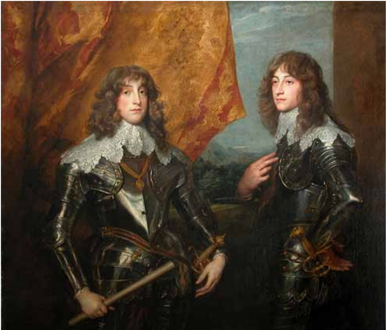
Anthony van Dyck (1599–1641), Die Pfalzgrafen bei Rhein Karl Ludwig und Rupert. 1637. Paris, Musée de Louvre

Als Kind hatte er den Ruf, eigensinnig und schlecht erzogen zu sein, aber er war so etwas wie ein Wunderkind