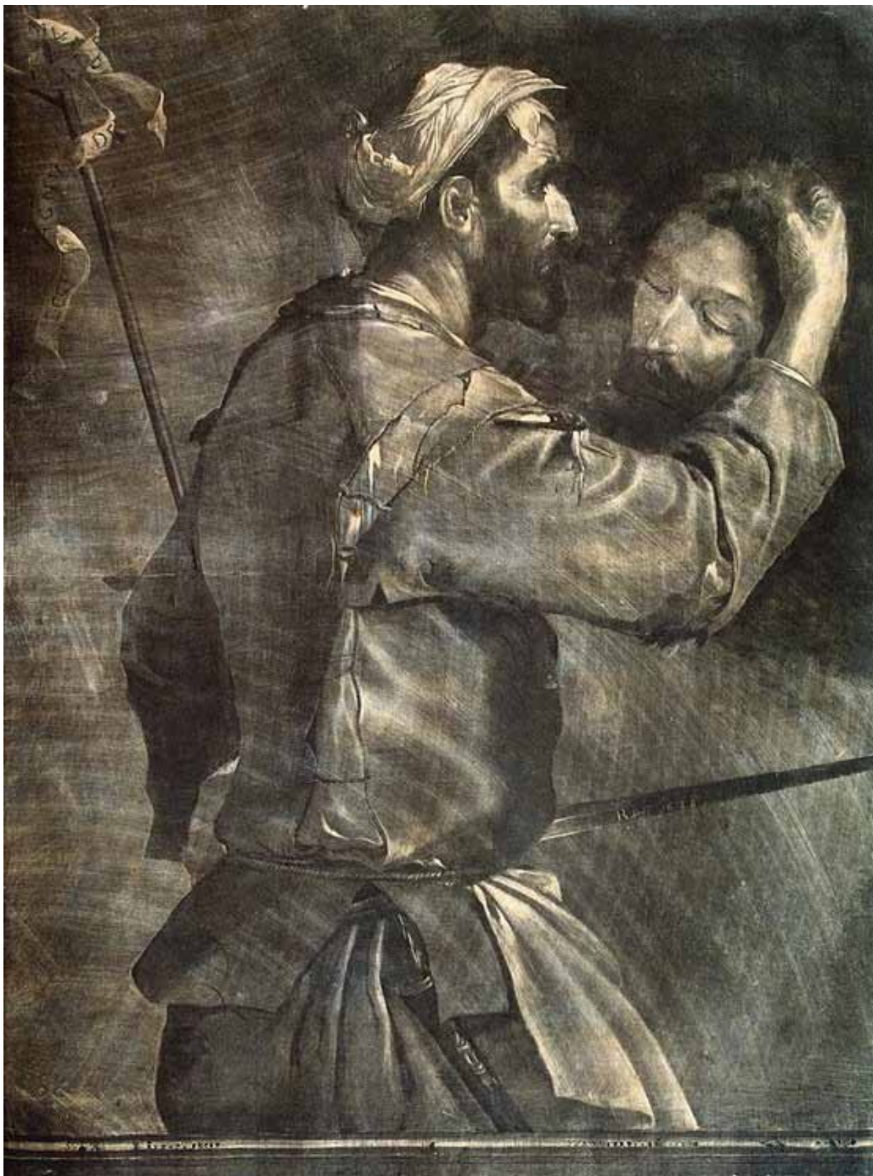
Prinz Rupert, „The Great Executioner“, die Hinrichtung Johannes des Täufers. Mezzotinto-Blatt, 1658.