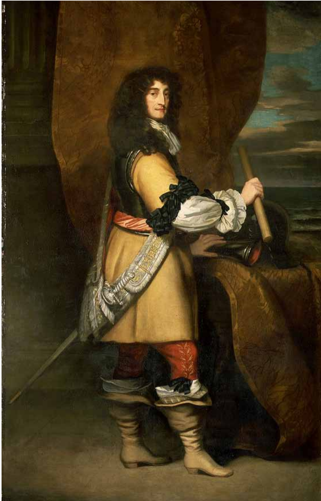
Nach Sir Peter Lely (1618–1680), Prince Rupert (1619-1682), 1st Duke of Cumberland and Count Palatine of the Rhine. 1834-1845 (diese Kopie); circa 1665 (Original). Öl auf Leinwand, 239.5 × 148.3 cm. National Maritime Museum, Greenwich, London