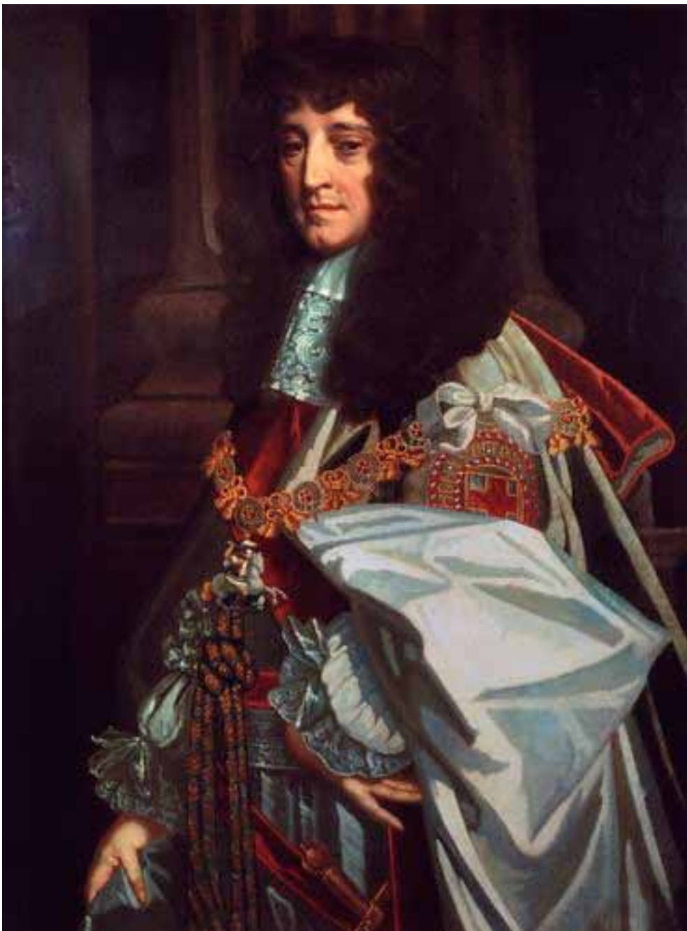
Sir Peter Lely (1618–1680), Prinz Rupert. 1670.

aus Böhmen aufwuchs, mehrfach von Anthonis van Dyck, einem der größten flämischen Maler des Barock, porträtiert. Die Gemälde hängen heute im Kunsthistorischen Museum in Wien und in der Nationalgalerie in London.